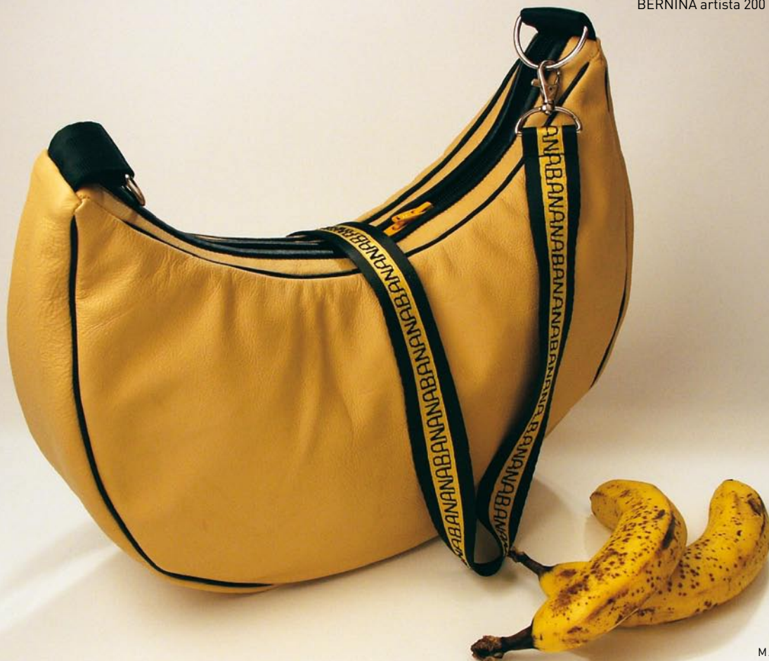
Diese Tasche wurde mit einer BERNINA artista 200 genäht.